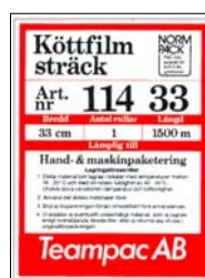
Etikett inuti bobinen

Klar och tydlig märkning är viktigt för rätt varuhantering. Teampac har etiketter både på yttre kartongen och inuti bobinen som filmen är rullad på. Det är till hjälp vid paketering och när kommunens nämnd utför livsmedelstillsyn.