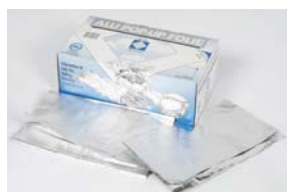
23027 Arkät för t ex bakpotatis