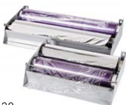
92130 92145 Kan användas till både film och folie...samtidigt!